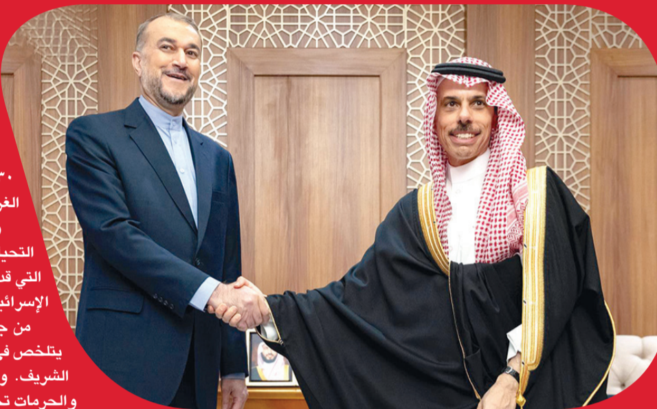
وزير الخارجية يلتقي نظيره الإيراني

من جهته، شدد الأمين العام للمنظمة حسين إبراهيم طه، على أن حل القضية يتلخص في إنهاء الاحتلال الإسرائيلي وإقامة الدولة الفلسطينية وعاصمتها القدس الشريف. ولفت الأمين العام إلى حقيقة استحالة إسرائيل لكل القوانين والمبادئ والحرمان تحت أنظار العالم. وقال إن المنظمة مع ٢٥ دولة قدمت معلومات موثقة عن الجرائم الإسرائيلية لمحكمة العدل الدولية وفي انتظار قرارها.