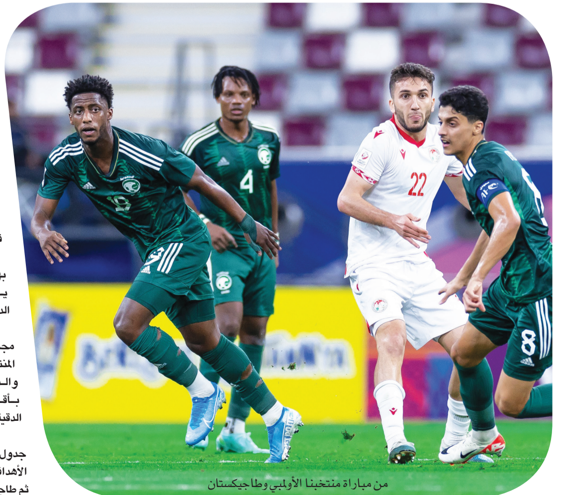
من مباراة منتخبنا الأولمبي وطاجيكستان

واحتل المنتخب السعودي قمة جدول ترتيب المجموعة الثالثة بفارق الأهداف عن منتخب تايلاند الوصيف، ثم طاجيكستان والعراق بدون نقاط.