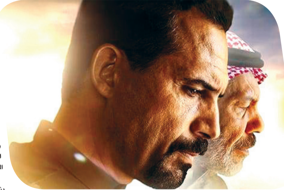
الفيلم السعودي «إلى ابني»

وإلى جانب الفيلمين السعوديين يشارك بالمهرجان مجموعة من الأفلام العربية من مختلف دول العالم العربي.