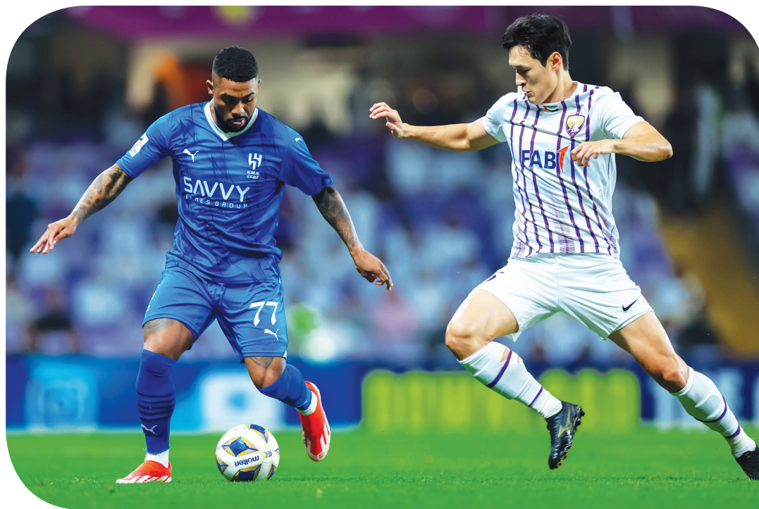
من مباراة الذهاب بين الهلال والعين

فقد سجل الدوسري هدفاً حاسماً في مباراة الإياب حيث تغلب الهلال على السد 6-0 في مجموع المباراتين في طريقه إلى اللقب في عام 2019، كما سجل هدف