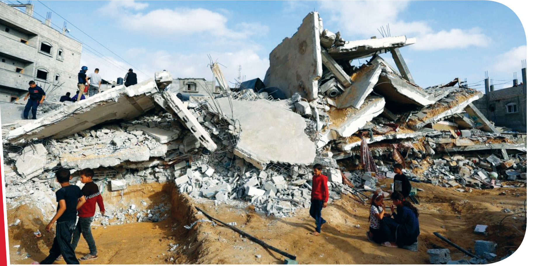
غزة - عواصم العالم - متابعات