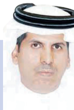
محمد المرواني @mohmdmrwany

يقول لي أحد الأصدقاء ممن يعمل بهذا المجال: كان كل شيء منظماً، وكان الجميع سعداء بالتسهيلات التي قدمت لإتمام توقيع الاتفاقيات بكل سهولة ويسر. نجاح رؤية ٢٠٣٠ تعتمد على الكفاءات التي وضعت بها الثقة من قبل حكومة خادم الحرمين الشريفين الملك سلمان بن عبدالعزيز وسمو ولي عهده الأمير محمد بن سلمان -يحفظهما الله- اللذين يتابعان كل صغيرة وكبيرة تساعد على هذا النجاح.. فوضع الثقة بالدكتور توفيق الربيعة لم تأت من فراغ، ففي كل موقع؛ مسؤول كان النجاح ملازماً لعمله، وزاده رفعة ومكانة وعلو شأن، وزاده توفيقاً، وسداداً، ونجاحاً، حقاً وصدقا.. هذا ولي العهد فخرّ الوطن.