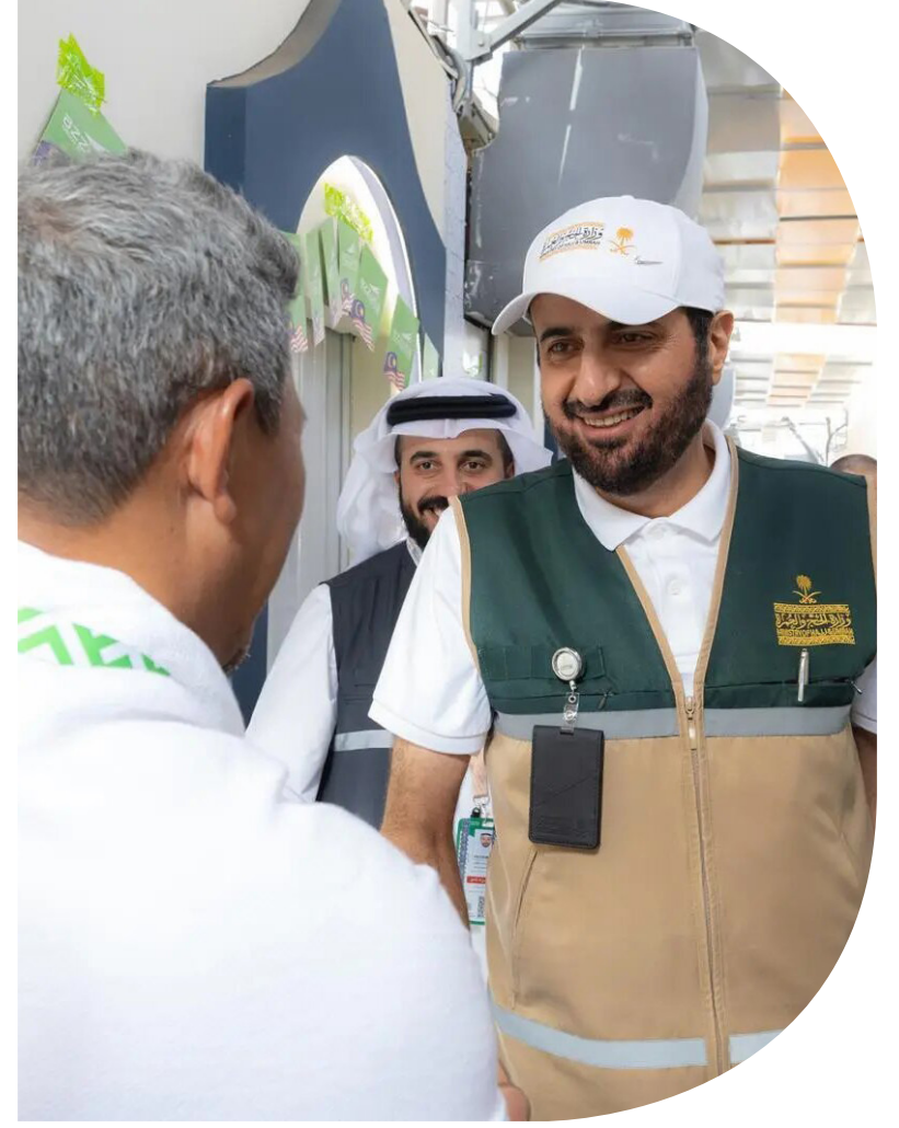
المدينة - منى

تفقد وزير الحج والعمرة الدكتور توفيق بن فوزان الربيعة، مخيمات الحجاج في مشعر منى، وذلك في إطار المتابعة المباشرة للاستعدادات التشغيلية لموسم حج ١٤٤٧ هـ، وإطلع خلال الجولة - على جاهزية مرافق الإقامة، ومستوى الخدمات التشغيلية المقدمة داخل المخيمات - بما يشمل خدمات الإعاقة، والنظافة، والصيانة، إلى جانب الترتيبات التنظيمية المتعلقة باستقبال الحجاج، وتيسير تنقلهم داخل المشاعر المقدسة، بما يسهم في توفير تجربة حج تنسجم باليسر والطمأنينة. كما التقى بعدد من العاملين والمشرفين الميدانيين، واستمع إلى شرح حول سير الخطط التشغيلية، واليات التنسيق بين الجهات ذات العلاقة، مؤكداً أهمية الجاهزية الميدانية، ورفع كفاءة الأداء التشغيلي، واستمرار التكامل بين مختلف مكونات منظومة الحج؛ لضمان جودة الخدمات المقدمة للحجاج خلال أيام الموسم.