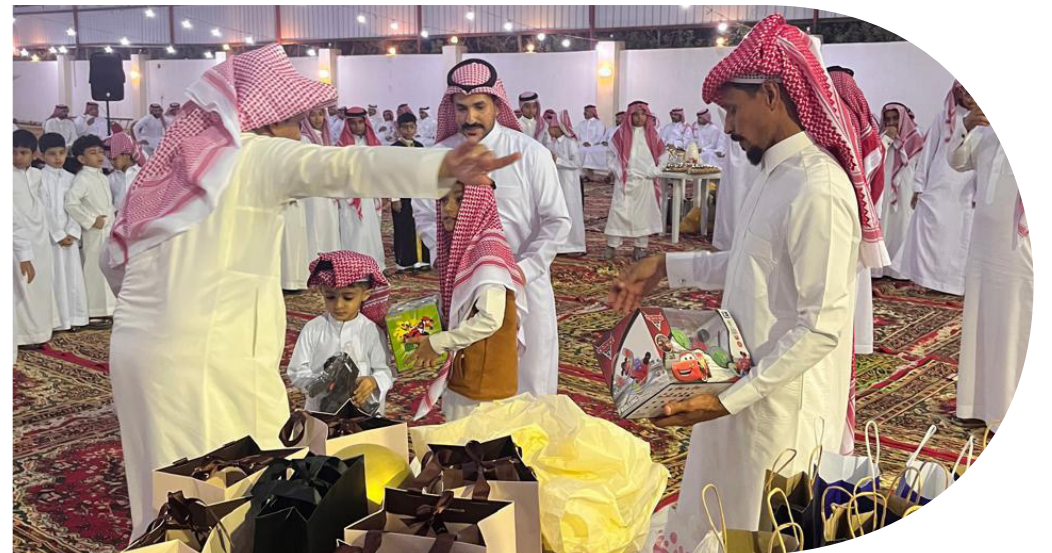
شباب يحتفلون بالعيد في إحدى الاستراحات