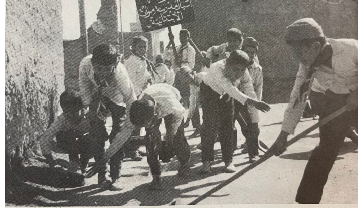
المريخ خلال مشاركته بمعسكر الحج