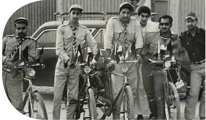
الحفاش خلال مشاركته في معسكر الحج

وتركزت مشاركات المغردين على تنظيم عربات الجولف في المسجد الحرام، عبر توضيح أماكن التذاكر للحجاج والمعتمرين، وإصدار تصاريح لسكان مكة تسهل عليهم التنقل خلال موسم الحج، واستبدال ببعض نقاط التفتيش، الرصد