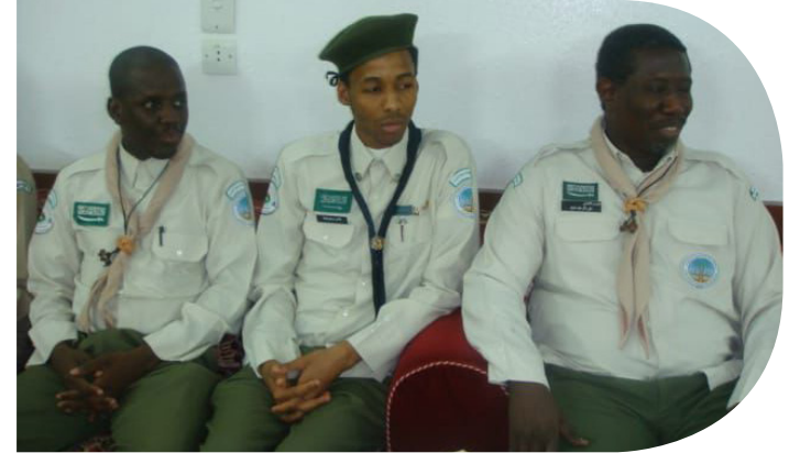
هوساوي في أحد معسكرات الحج