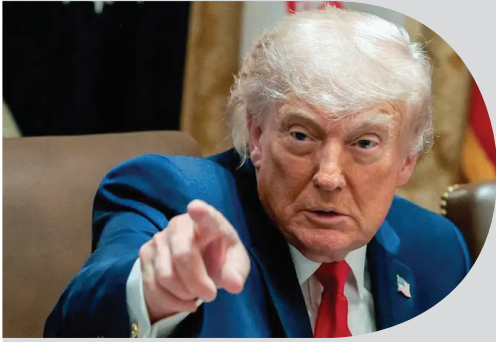
واشنطن - طهران - متابعات

ترامب: التقارير عن توقف الحوار «كاذبة وخاطئة» إيران: نصنا النهائي ما زال قيد المناقشة في طهران