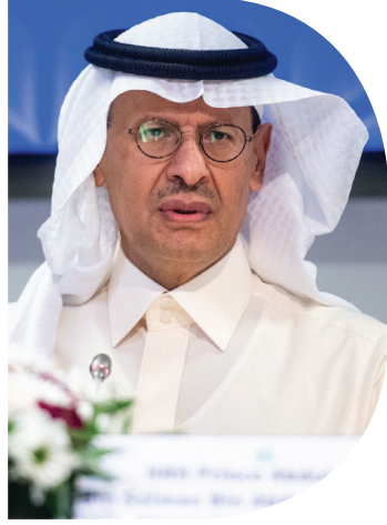
المدينة - الرياض

جزئي أو كامل، تدريجياً، حسب متغيرات السوق. وستواصل الدول المشاركة متابعة وتقييم ظروف السوق بشكل دقيق، وفي إطار جهودها المستمرة لدعم استقرار السوق، أكدت الدول السبع مجدداً على أهمية تبني نهج حذر والاحتفاظ بمرونة كاملة، تتيج زيادة، أو إيقاف، أو عكس إعادة التدريجية لتعديلات الإنتاج الطوعية، بما في ذلك عكس التعديلات الطوعية السابقة التي أعلن عنها في نوفمبر 2023م. ونوهت الدول السبع الأعضاء في مجموعة أوبك بلس إلى أن هذا الإجراء سيوفر فرصة للدول المشاركة لتسريع عملية التعويض، وجددت الدول السبع التزامها بإعلان التعاون، بما في ذلك التعديلات الطوعية الإضافية التي سيتم مراقبة الالتزام بها من قبل لجنة الرقابة الوزارية المشتركة، وأكدت الدول عزمها على تعويض كامل كميات الإنتاج الزائدة منذ يناير 2024م، وستمدد فترة التعويض حتى نهاية شهر ديسمبر 2026م. وستعد الدول السبع اجتماعات شهرية لمتابعة تطورات السوق، ومستوى الالتزام، وتنفيذ خطط التعويض، على أن يُعقد الاجتماع القادم في 5 يوليو 2026م.