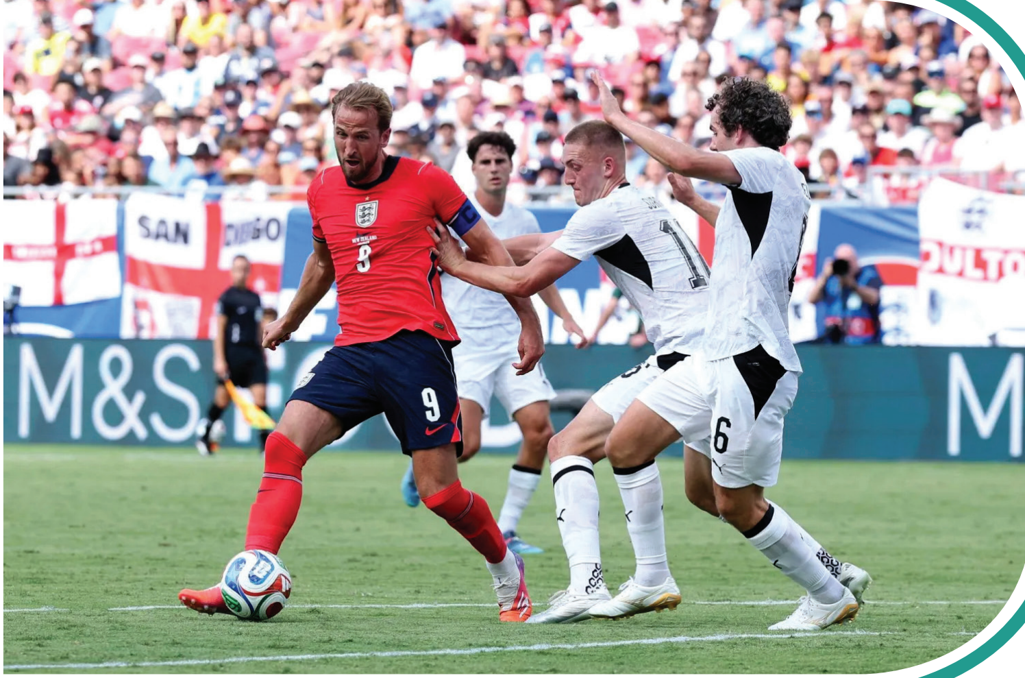
من ودية إنجلترا ونيوزيلندا، السبت

سلط المدير الفني لمنتخب إنجلترا توماس توخيل، الضوء على مشكلتين قد تواجههما الفرق المشاركة بكأس العالم، هما الحر، وسوء أرضية الملعب، وذلك بعد فوز صعب على نيوزيلندا في ودية استعدادًا للمونديال، السبت.