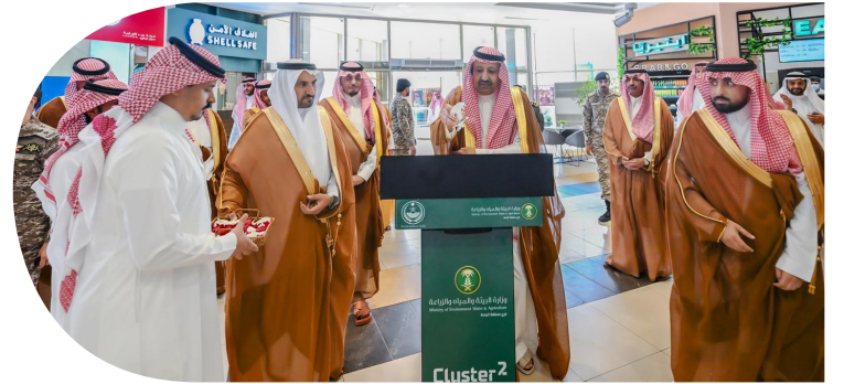
المدينة - الباحة

دشن صاحب السمو الملكي الأمير الدكتور حسام بن سعود بن عبدالعزيز أمير منطقة الباحة، بحضور صاحب السمو الأمير فهد بن سعد بن عبدالله بن تركي نائب أمير المنطقة، أمس، مبادرة «هذا موسمها» في مطار الملك سعود بن عبدالعزيز بالباحة، التي ينفذها فرع وزارة البيئة والمياه والزراعة بالمنطقة، بالتعاون مع تجمع المطارات الثاني؛ بهدف التعريف بمنتجات المنطقة الزراعية وتسويقها أمام الزوار والمسافرين. وكان سموه وسمو نائبه قد تفقدا مشروع استكمال تنفيذ تطوير مطار الملك سعود بالباحة، واطلعا على سير الأعمال ومراحل التنفيذ الجارية بالمشروع.