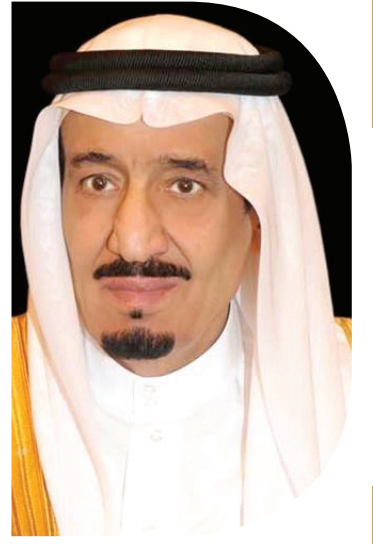
واس - جدة