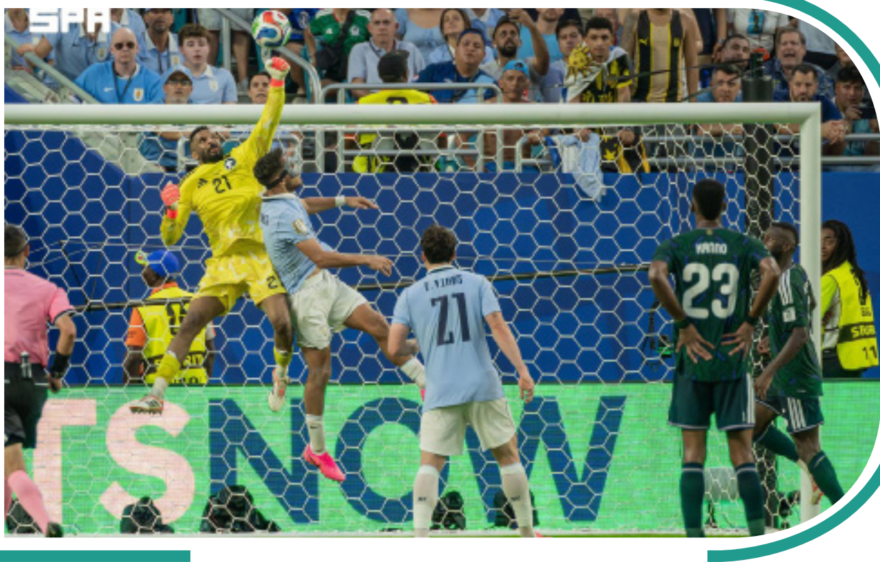
«أراخو يحرّم السعودي من انتصار تاريخي... التعادل 1-1 في ميامي».