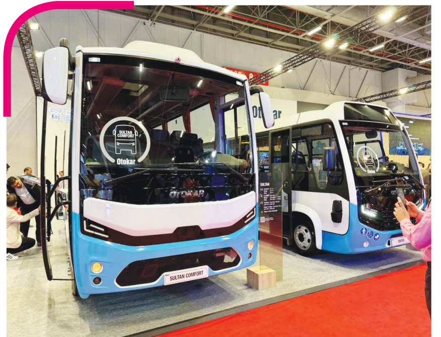
رستت شركة «أوتوكار» (Otokar)، الرائدة في سوق الحافلات التركي لـ ١٧ عاماً متتالية، مكانتها الطبيعية في قطاع النقل الجماعي من خلال مشاركة بارزة في معرض Busworld Türkiye 2026 (باص وورلد تركيا ٢٠٢٦) المنعقد حالياً في مركز إسطنبول للمعارض وتأتي مشاركة الشركة هذا العام بالتزامن مع الاحتفال